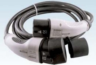
EV Ladekabel 16A Typ 2 zu Typ 2 - 5 Meter Kabel für Wallbox dreiphasig