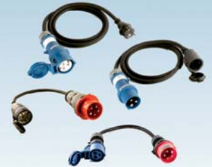
Wallbox24 - 4er SET Adapterkabel