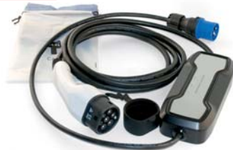
Tragbare Wallbox für Elektrofahrzeuge/ Hybrid Ladestation mit CEE Stecker, Ladestecker Typ 2 16A