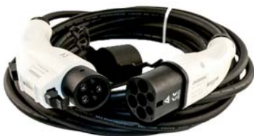
EV Ladekabel 16A Typ 2 zu Typ 1 - 10 Meter Kabel für Wallbox einphasig