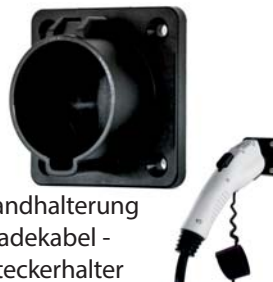
Wallbox24 Wandhalterung für Typ 1 EV Ladekabel - Elektroauto Steckerhalter