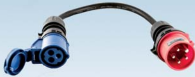
Wallbox24 CEE Adapter 16A 5 polig Stecker Starkstrom auf CEE 230V 3 polige Kupplung