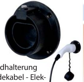
Wallbox24 Wandhalterung für Typ 2 EV Ladekabel - Elektroauto Steckerhalter