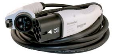
EV Ladekabel 16A Typ 2 zu Typ 1 - 5 Meter Kabel für Wallbox einphasig