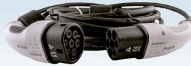
EV Ladekabel 16A Typ 2 zu Typ 2 - 10 Meter Kabel für Wallbox einphasig