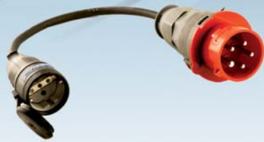
Wallbox24 CEE Adapter 16A 400V Stecker Starkstrom auf 230V Schuko Kupplung