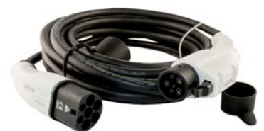
EV Ladekabel 32A Typ 2 zu Typ 1 - 10 Meter Kabel für Wallbox einphasig