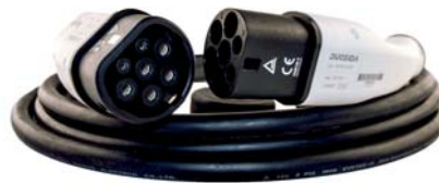
EV Ladekabel 32A Typ 2 zu Typ 2 - 5 Meter Kabel für Wallbox einphasig