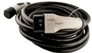
EV Ladekabel 32A Typ 2 zu Typ 2 - 10 Meter Kabel für Wallbox dreiphasig