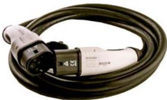
EV Ladekabel 32A Typ 2 zu Typ 2 - 5 Meter Kabel für Wallbox dreiphasig