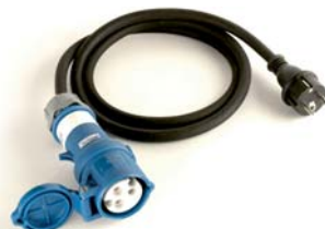
Wallbox24 CEE Adapter 16A 230V 3 Polig Starkstrom auf 230V Schuko Stecker