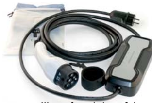
Tragbare Wallbox für Elektrofahrzeuge/ Hybrid Ladestation mit Schuko Stecker, Ladestecker Typ 2 16A