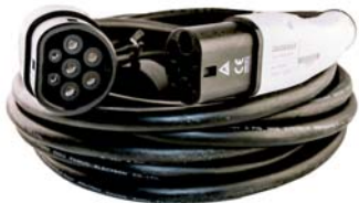
EV Ladekabel 32A Typ 2 zu Typ 2 - 10 Meter Kabel für Wallbox einphasig