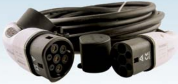
EV Ladekabel 16A Typ 2 zu Typ 2 - 10 Meter Kabel für Wallbox dreiphasig