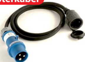
Wallbox24 CEE Adapter Stecker 16A 230V 3 Polig Starkstrom auf 230V Schuko Kupplung