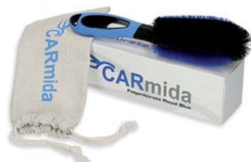
Premium Auto Felgenbürste