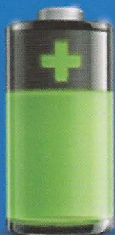
Aufladbarer Lithium Akku