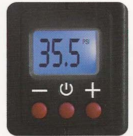
Minus Switch Plus